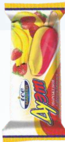
冰棒二重奏草莓和香蕉