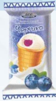
ICE MASTER 蓝莓/冰大师蓝莓