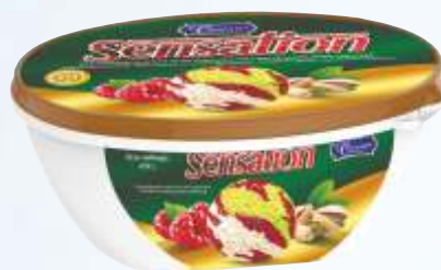
SENSATION 开心果、奶油冻和覆盆子。 森萨歧视 开心果、奶油冻和覆盆子。