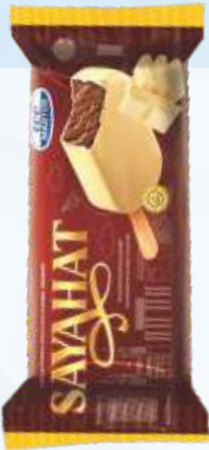
SAYAHAT 萨雅哈特 白釉巧克力冰淇淋