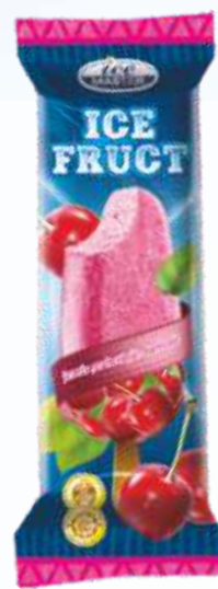
ICE FRUIT 樱桃/冰果樱桃