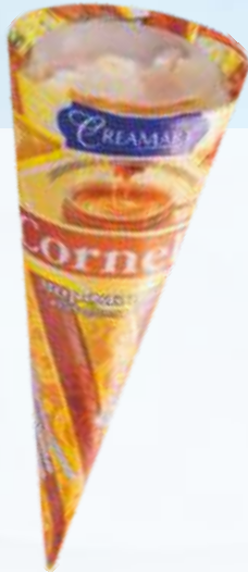
CORNELLI 煮炼乳/科尔内利 煮炼乳