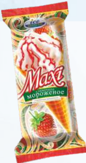
MAXI 草莓甜筒/马克西 草莓甜筒