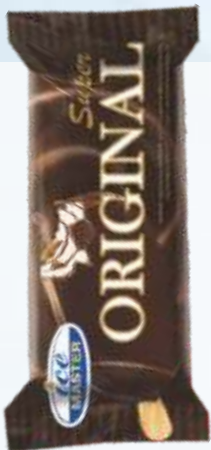
SUPER ORIGINAL 超级原版