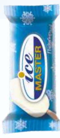
ICE MASTER 冰大师冰淇淋