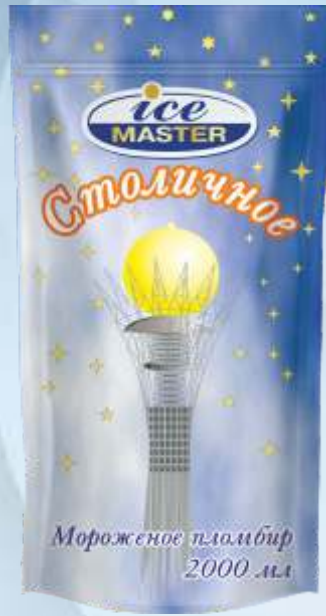
STOLICHNOYE 奶油冰淇淋/斯托利奇诺耶奶油冰淇淋