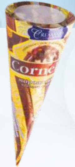
CORNELLI 巧克力顶/科尔内利巧克力顶