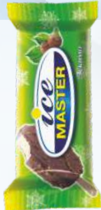
ICE MASTER 香草冰棒，加坚果 冰大师香草冰棒，加坚果