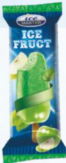
ICE FRUIT 苹果/冰冻苹果