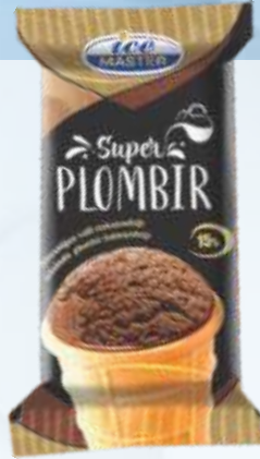
超級冰淇淋 巧克力