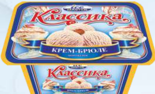
CLASSIC 焦糖布丁/经典焦糖布丁