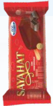
SAYAHAT 萨雅哈特 巧克力冰淇淋