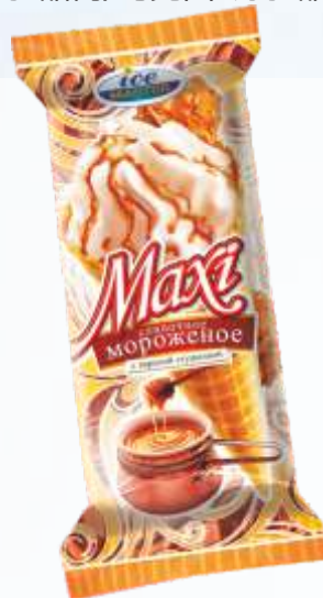
MAXI 炼乳甜筒/马克西 炼乳甜筒