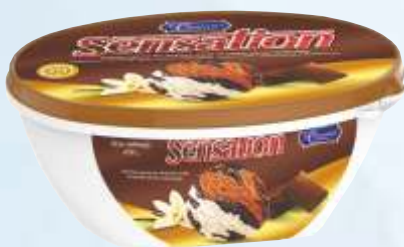
SENSATION 巧克力香草味/森萨歧视 巧克力香草味