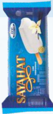
SAYAHAT 萨雅哈特 香草冰淇淋