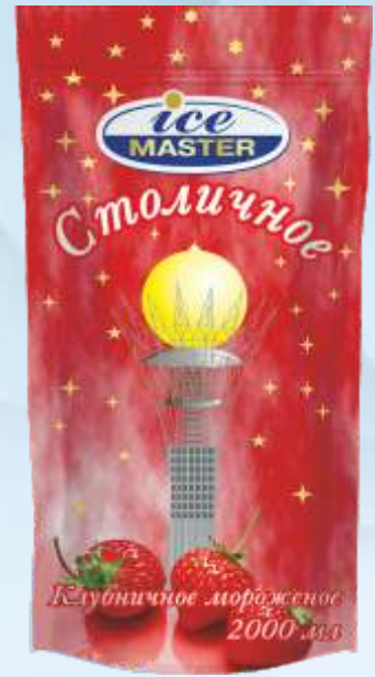
STOLICHNOYE 奶油冰淇淋/斯托利奇诺耶草莓冰淇淋