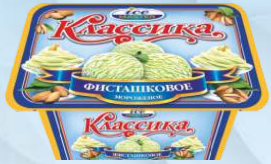
CLASSIC 开心果/经典开心果