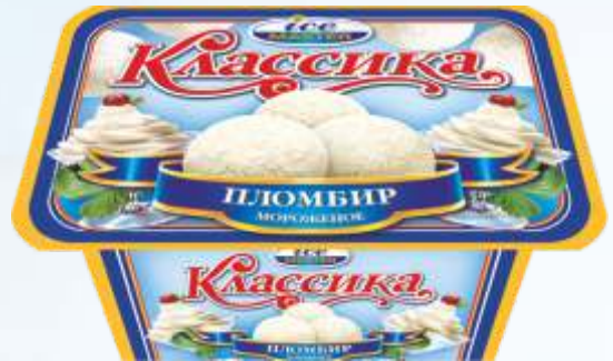
CLASSIC 冰淇淋/经典冰淇淋