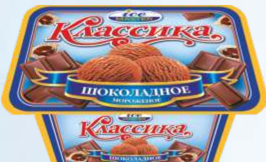
CLASSIC 巧克力/经典巧克力