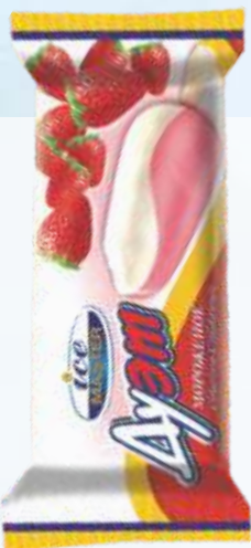
奶油草莓/冰棒二重奏奶油草莓