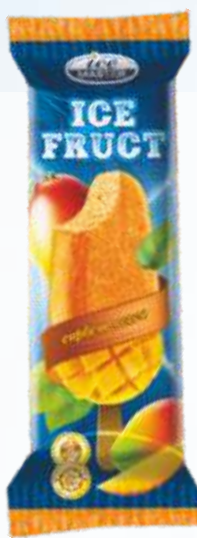
ICE FRUIT 芒果/冰果芒果