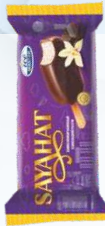
SAYAHAT 萨雅哈特 巧克力釉香草冰淇淋