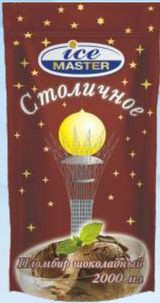
STOLICHNOYE 巧克力冰淇淋/斯托利奇诺耶巧克力冰淇淋