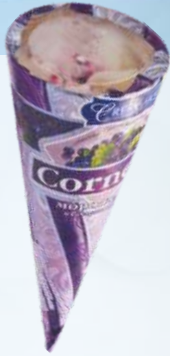
CORNELLI 加仑子/科尔内利 加仑子