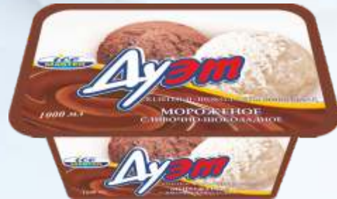
DUET 奶油-巧克力/杜埃特奶油-巧克力