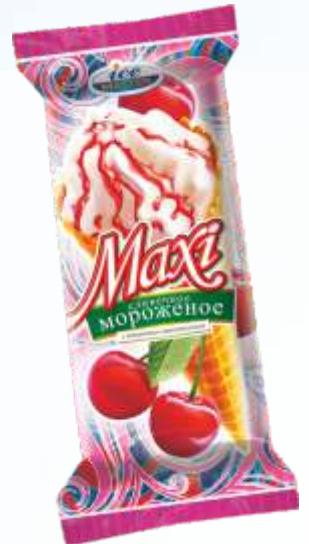
MAXI 锥形樱桃/马克西锥形樱桃