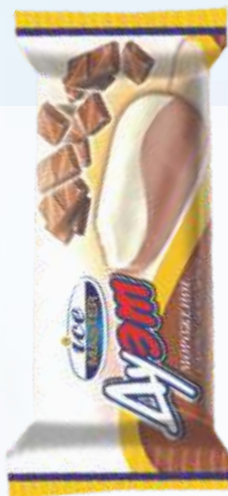
奶油巧克力/冰棒二重奏奶油巧克力