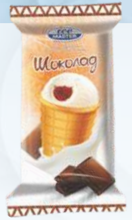
ICE MASTER 巧克力/冰大师巧克力