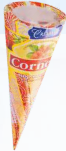
CORNELLI 草莓/科尔内利 草莓