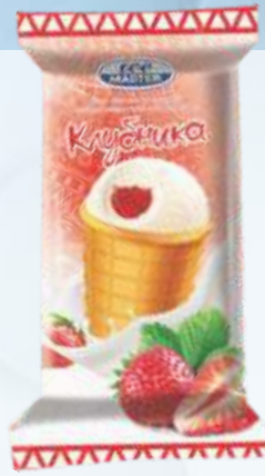
ICE MASTER 草莓/冰大师草莓