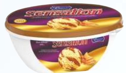
SENSATION 咸味焦糖 森萨歧视 咸味焦糖